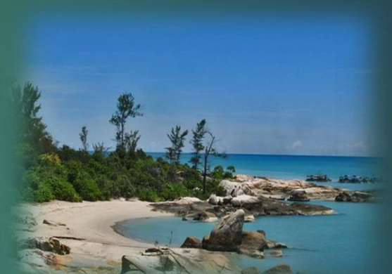
PANTAI TIKUS, SUNGAILIAT