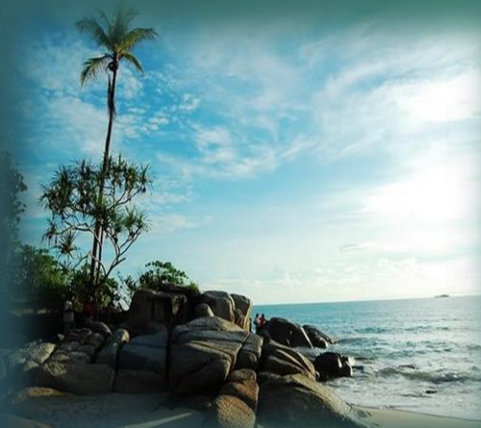
PANTAI PASIR PADI PANGKALPINANG