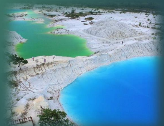
DANAU KAOLIN, BANGKA TENGAH