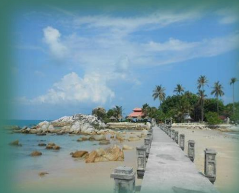
PANTAI PARAI TENGGIRI, SUNGAILIAT