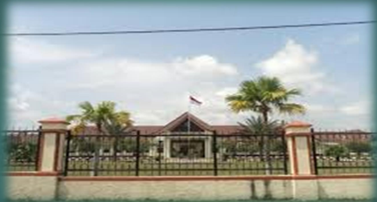
Rumah Dinas Gubernur Babel