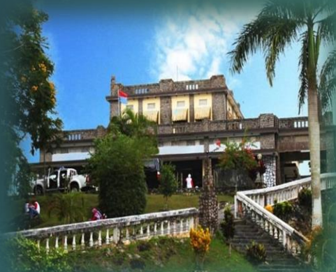
GUNUNG MENUMBING, MENTOK