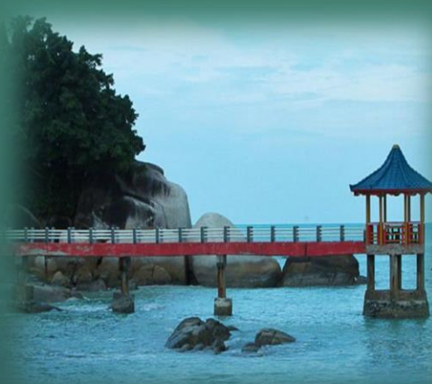
PANTAI TANJUNG PESONA, SUNGAILIAT